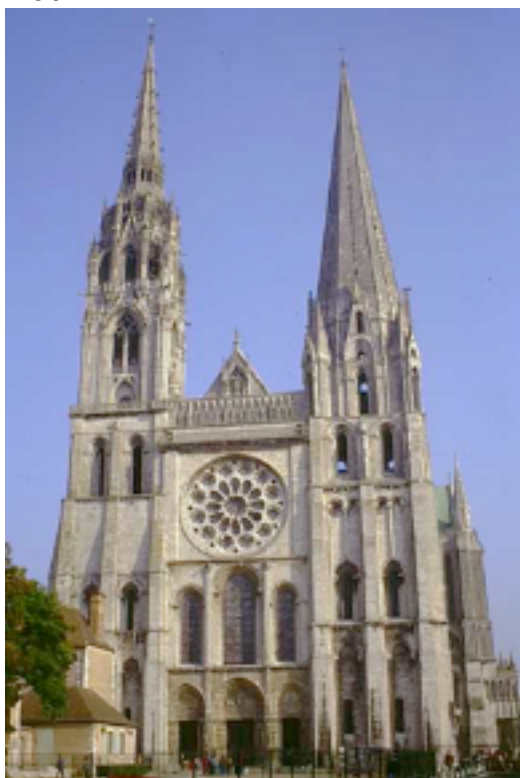
Cattedrale di Chartres

E' al portale nord della Cattedrale di Amiens che gli alchimisti si riunivano per discutere sull'inizio della Grande Opera. A ovest spesso si trovano bassorilievi sul giudizio universale e a sud un grande rosone che fa filtrare la luce del sole in tutta la sua forza. All'esterno i portali sono sormontati da un nartece, portico coperto, dove sostavano i profani prima del battesimo. Luogo non ancora sacro, ma non più appartenente al mondo profano, ultimo avviso a creare in noi uno stato interiore consonante con la spiritualità dell'interno del Tempio. Dall'alto delle torri si vede il mondo intero dicono gli iniziati.