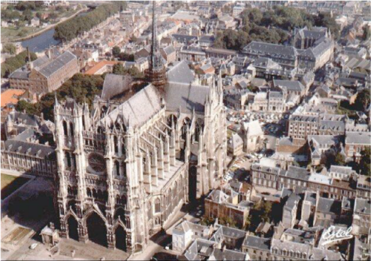
Cattedrale di Amiens

L a Cattedrale gotica è quindi la “ Cattedrale del simbolo ”.