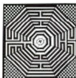
Labirinto di Chartres

N ei Labirinti delle Cattedrali, altrimenti chiamati il cammino di Gerusalemme, malgrado le apparenze, era impossibile perdersi. Esisteva infatti un solo accesso ed un' unica via percorribile per arrivare al centro. Questo a significare che la via iniziatica è una ed è sufficiente per arrivare al centro del nostro essere.