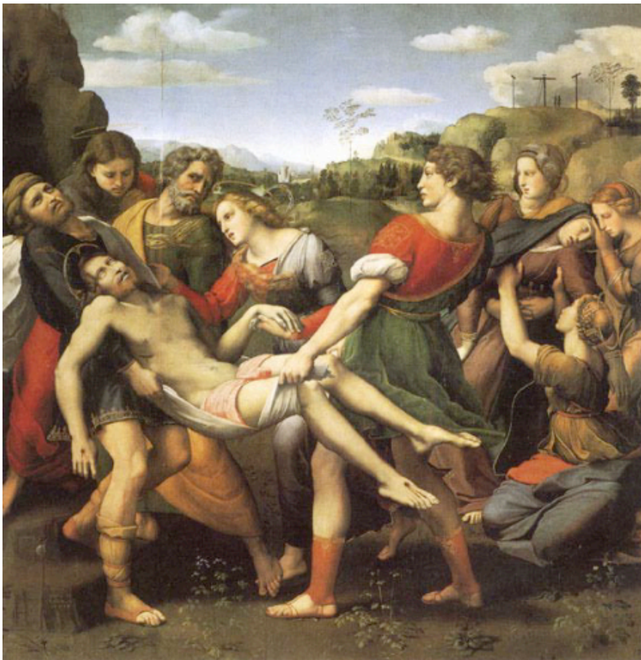
Raffaello - Deposizione borghese

1507 Olio su tavola; m1,80x1,76. Roma, galleria Borghese Maddalena e Gesù con Maria in secondo piano