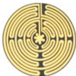
Labirinto di Amiens

A ll'inizio del pavimento della navata centrale era posto il Labirinto. Quasi tutti sono andati distrutti, ma ad Amiens (rifatto) e a Chartres (originale) ancora rimangono a testimoniare una segreta saggezza.